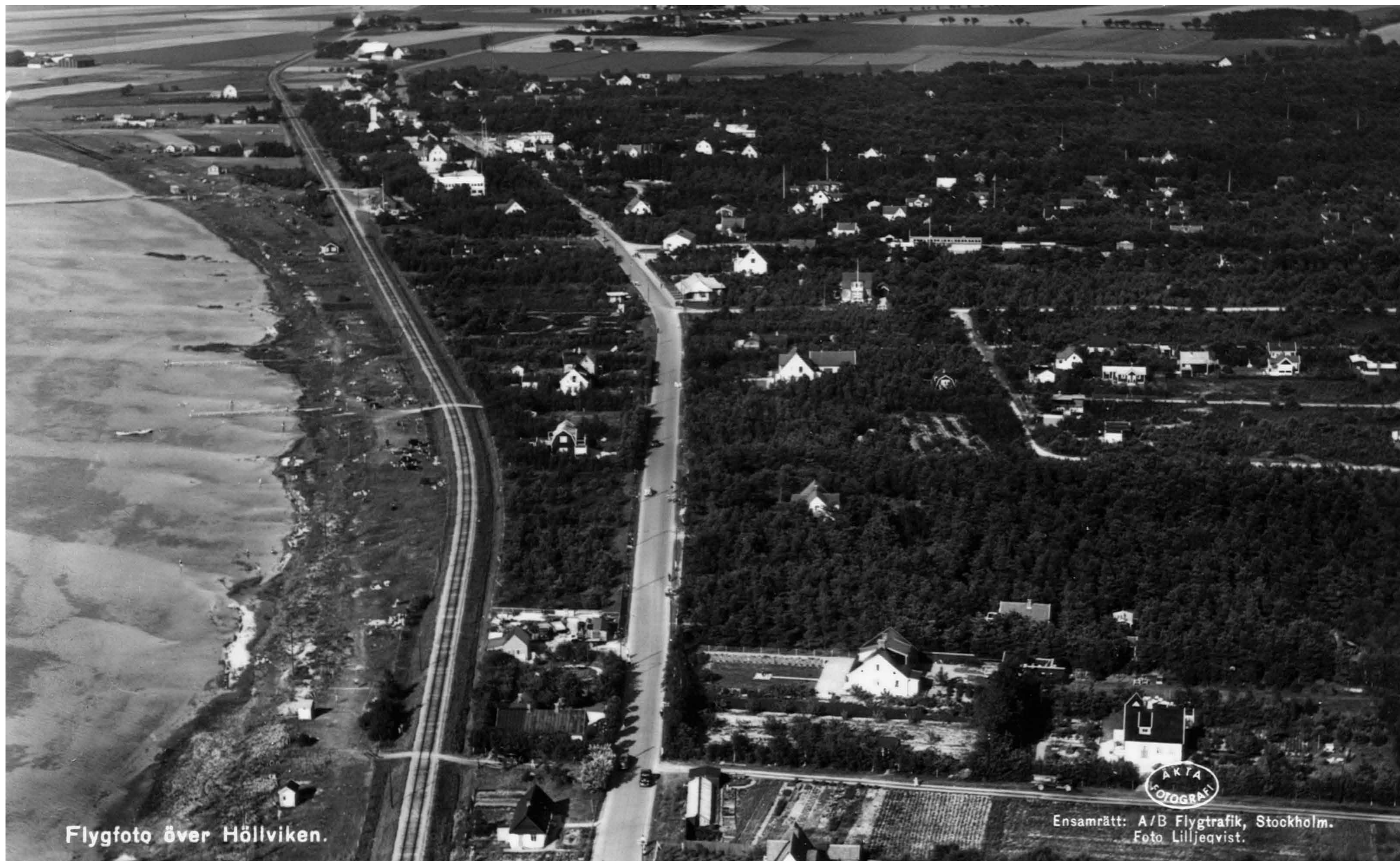
Bilden är tagen från Kanalen mot Höllviken 1938. Längst ner syns Truls i Brunnens hus. Saluhallen är byggd men inte Ljungbaren vid nuvarande Lotus House. Järnvägen ligger där nu kustvägen går.