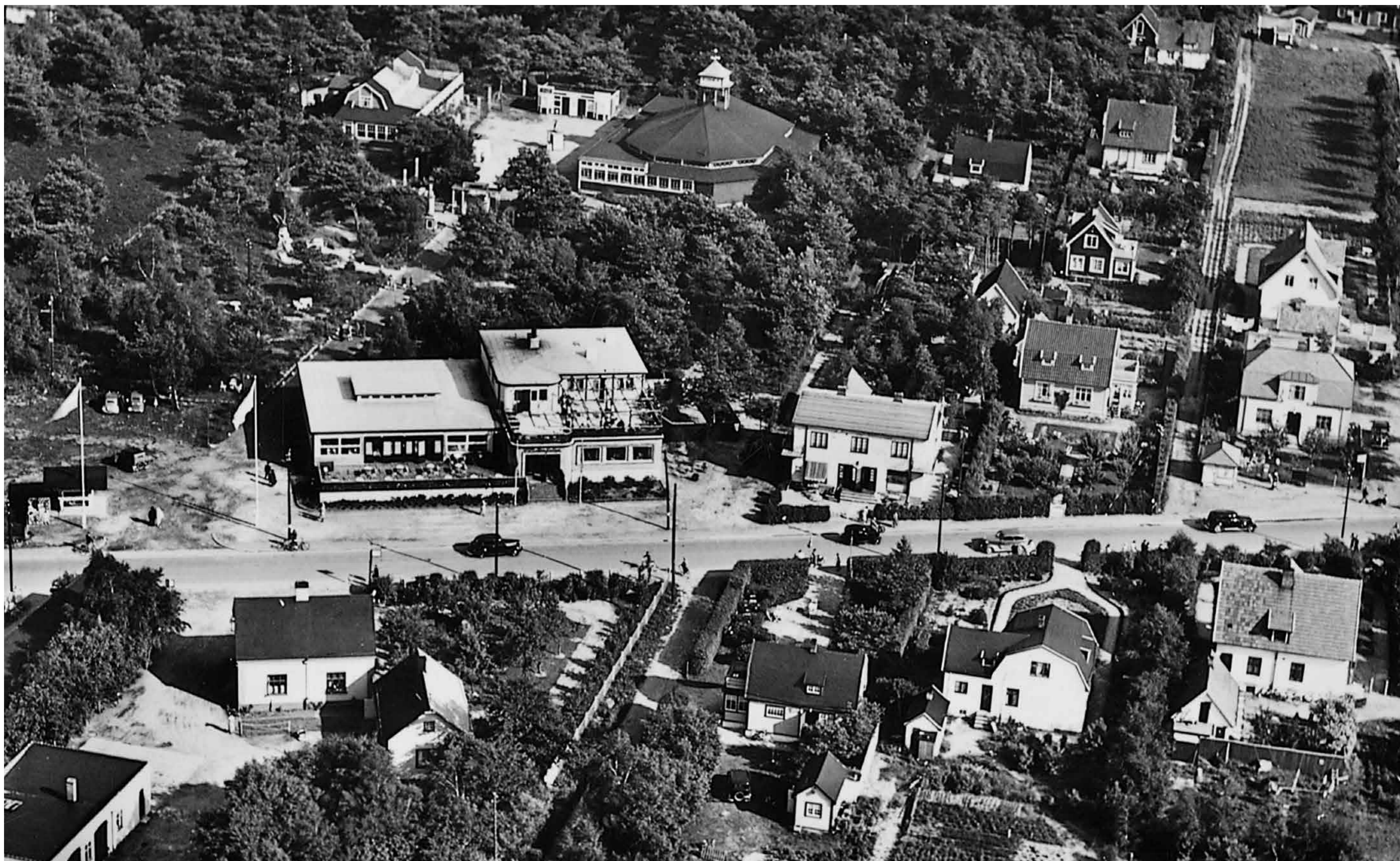
Detta var centrala Höllviken under 1920- och 30-talet. Överst syns Furets dansbana med restaurangen till vänster. I mitten Höllviksgården med Centrums Matsalar och Ringdahls Elektriska – på senare tid känt som Norells. Hitom Falsterbovägen ligger Strandstugans Café i mitten med föregångaren till Shellmacken/Bilisten till vänster.