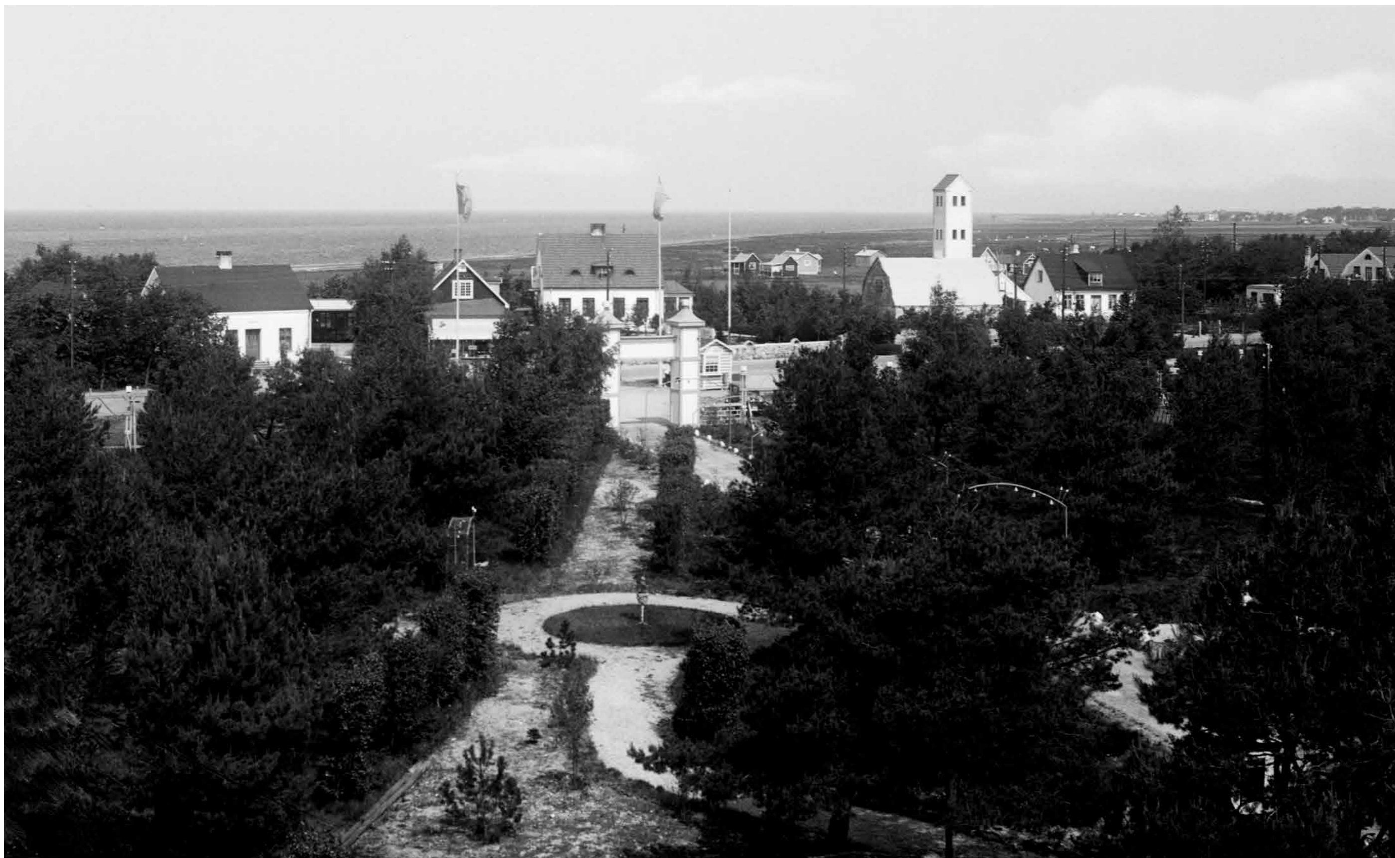
Detta är ingen regelrätt flygbild, den är tagen från lanterninen på Furets dansbana 1938. Genom Furets trädgård ser vi ut mot Falsterbovägen och havet. Huset till vänster är Shellmacken/Bilistens föregångare, nuvarande hus byggdes 1949. Gamla brandstationen med sitt torn är lätt att känna igen till höger.