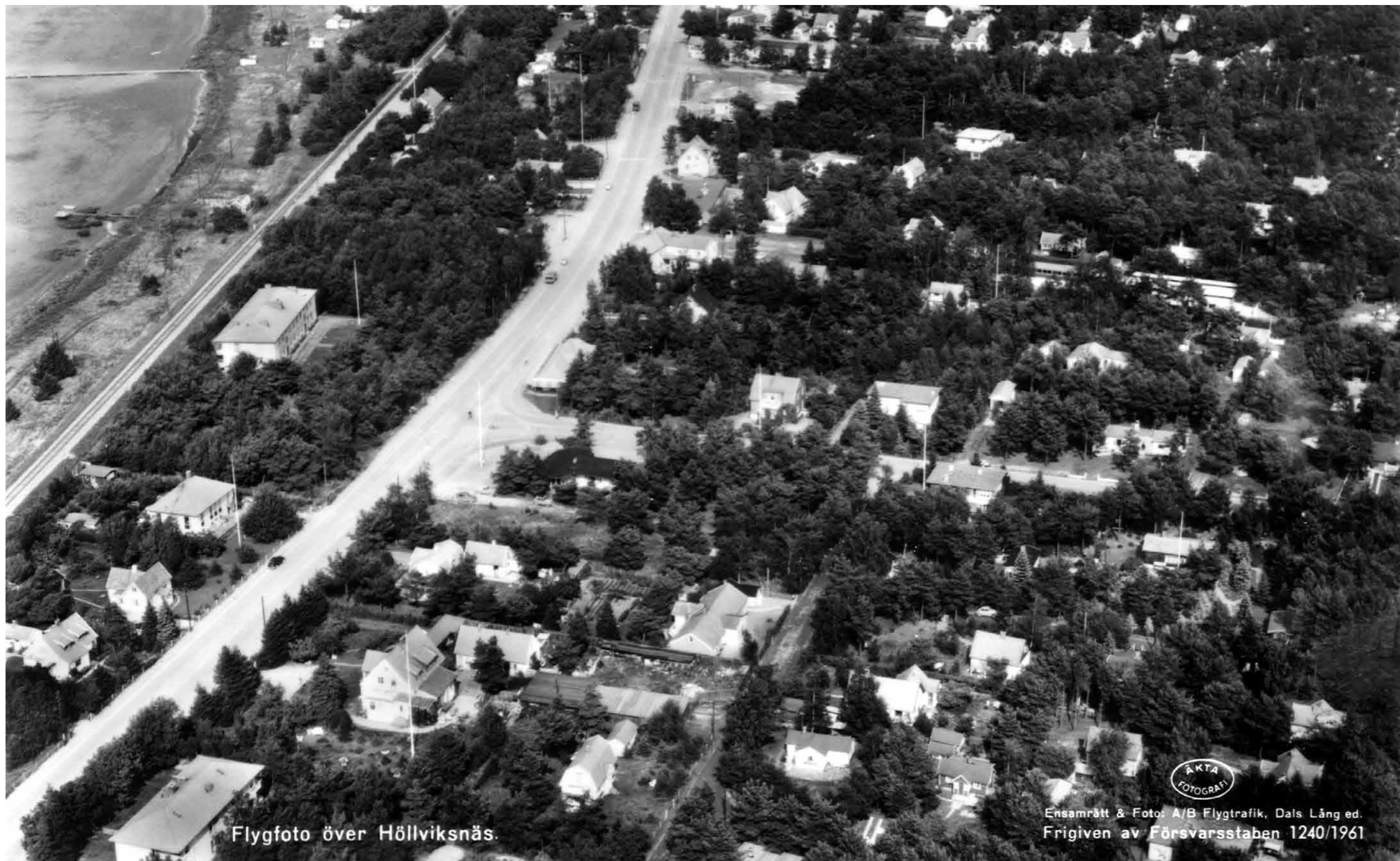
Flygfoto över Höllviksnäs.

ÅKTA FOTOGRAFI  Frigiven av Försvarsstaben 1240/1961