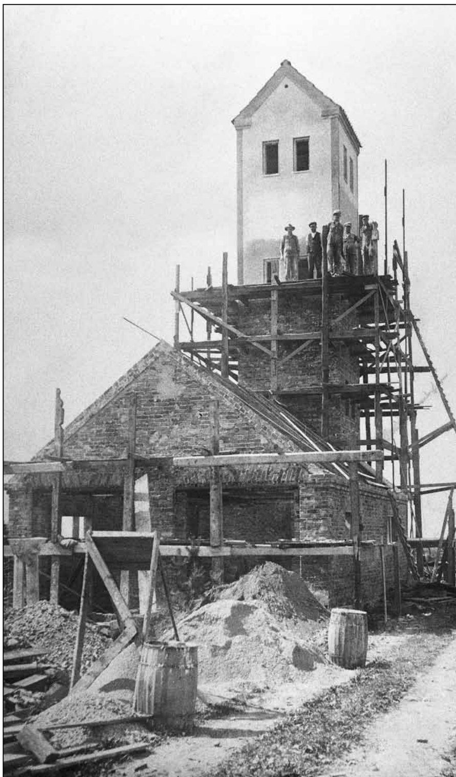
Höllvikens första brandstation byggs 1932.

Toaletter och en badbrygga sattes upp i början av 40-talet då fler besö-