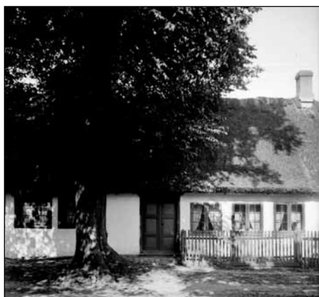
Söderlindhska gården vid hörnet av Mellangatan och Rådhusgatan i Skanör.