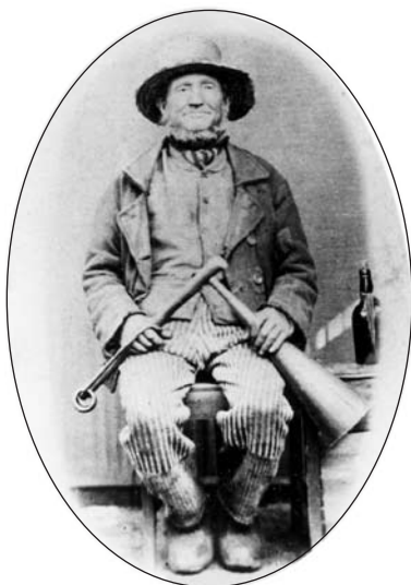
Hören i Skanör på 1870-talet med lur och ringstav.