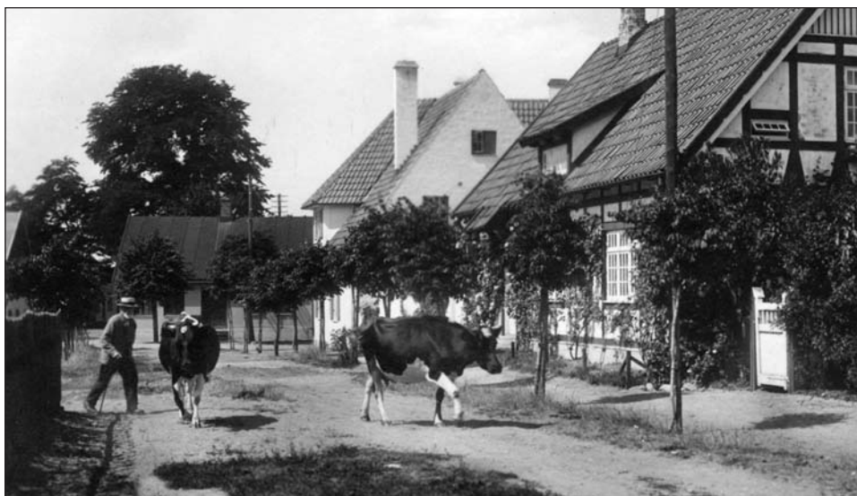
Gamlegatan i Falsterbo på 1920-talet. (från vykort)

Jag minns fortfarande kornas hostande, det var då inte aktuellt med att tuberkelinfria kor. Efter kvällsmjölkning tappades i två eller treliters spannar försedda med kundens mono-