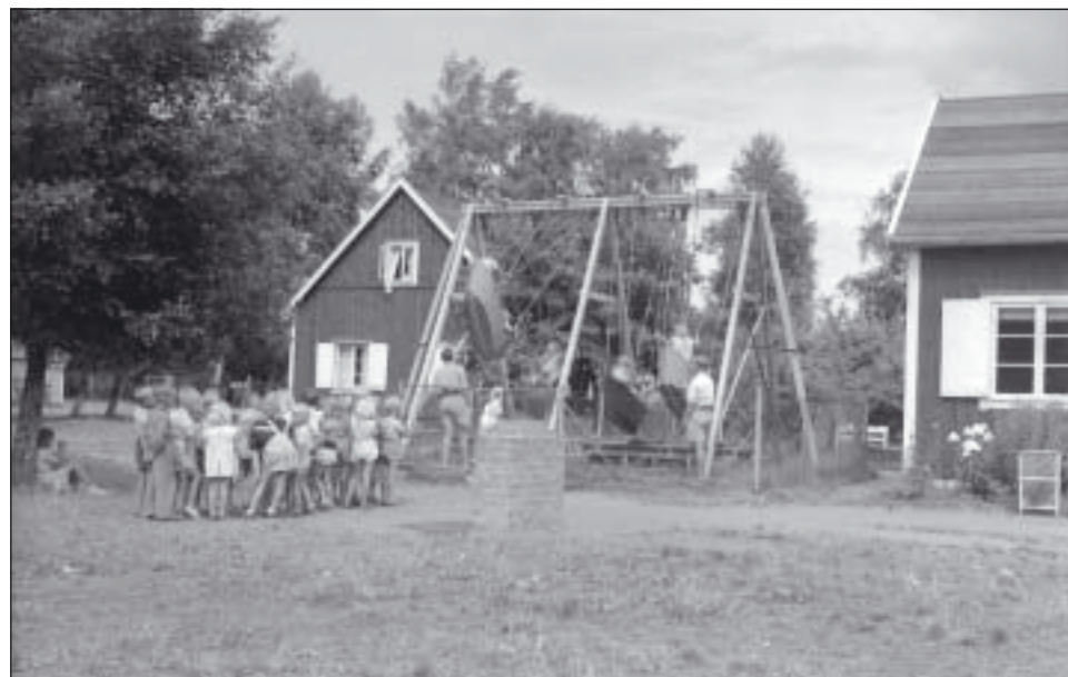
En bild från Malmö Sagostunders koloni på 1940-talet.

kring Trelleborgs skolovskoloni saknar vi material, bilder mm. Även från Eslövs kolonin saknar vi bilder och berättelser från barnen. Vi är inte heller helt säkra på under vilken tid kolonierna fanns. Starten vet vi ungefär, men när de lades och hur avvecklingen skedde har vi inga uppgifter om.