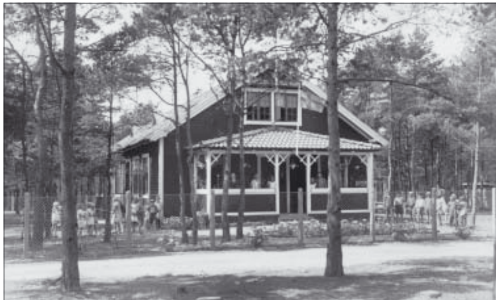
Trelleborgs skolovskoloni. Bilden införd i Trelleborgs Tidning 1929.

Vi bjuder på kaffe och kakor och alla är hjärtligt välkomna. Ta gärna med vänner och bekanta.