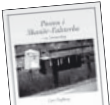
Posten i Skanör och Falsterbo av Lars Dufberg 80 kr.