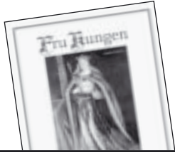
Fru Kungen av Marie Sjögren 70 kr.