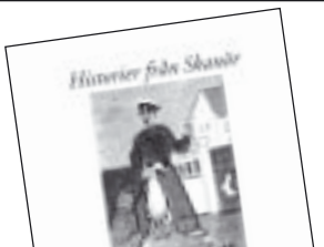
Historier från Skanör av Anders Carlsten 130 kr.