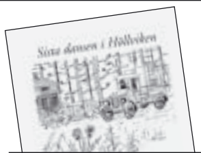
Sista dansen i Höllviken av Anders Carlsten 105 kr.