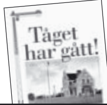
Tåget har gått! av Christian Kindblad 50 kr.