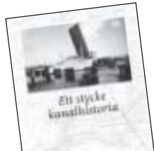
Ett stycke kanalhistoria av Sven Lundström m.fl. 45 kr.