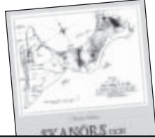
Skanör och Falsterbos historia från A till Ö av Christer Melin 95 kr.