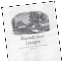
Resande över Ljungen av Christian Kindblad 90 kr.