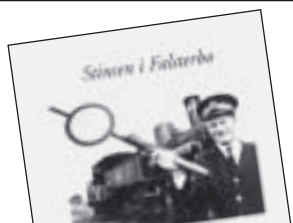
Stinsen i Falsterbo av Stig Mårtensson 125 kr.