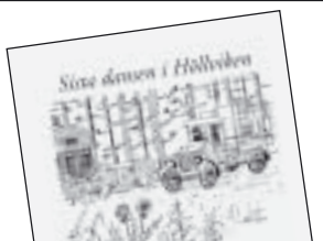
Sista dansen i Höllviken av Anders Carlsten 105 kr.