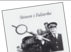
Stinsen i Falsterbo av Stig Mårtensson 125 kr.