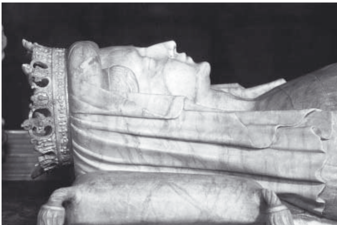
Närmare än såhär kommer vi inte drottning Margareta. Från hennes gravmonument i Roskilde domkyrka.