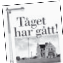
Tåget har gått! av Christian Kindblad 50 kr.