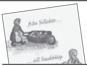
Från Sillabör till Snabbköp av Ingemar H. Johansson och Christian Kindblad 160 kr.