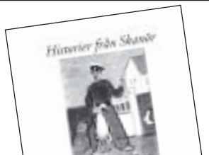
Historier från Skanör av Anders Carlsten 130 kr.