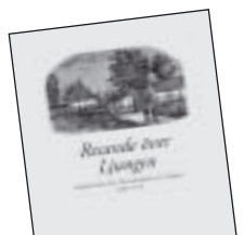
Resande över Ljungen av Christian Kindblad 90 kr.