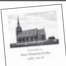
Stora Hammars kyrka 100 år av Ingemar H. Johansson 50 kr.