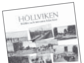
Höllviken - bilder och minnen från förr 125 kr.

På Ljungen ges ut av KULTURFÖRENINGEN CALLUNA