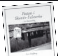
Posten i Skanör och Falsterbo av Lars Dufberg 80 kr.