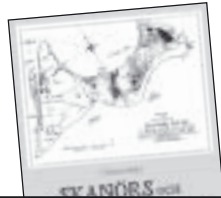
Skanör och Falsterbos historia från A till Ö av Christer Melin 95 kr.