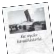
Ett stycke kanalhistoria av Sven Lundström m.fl. 45 kr.