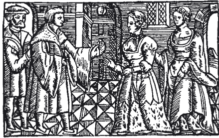
Medeltida bröllop ur Olaus Magnus »Historia om de Nordiska folken« 1555.

överdåd av mat och dryck, och underhölls med storslagna torneringar och riddarspel.