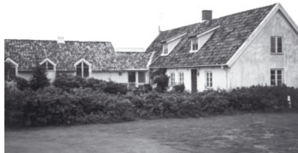
Södra Ljunghuset idag. Här huserar nu Ljungens golfklubbs juniorer.