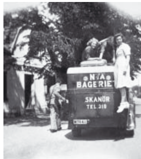
Vi biträden utanför Grönqvists 1945.

Bullar såldes också på torgdagarna. Strax efter kriget skedde utkörningen med häst och