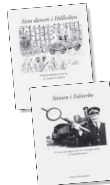
Sista dansen i Höllviken. Pris 130 kr.