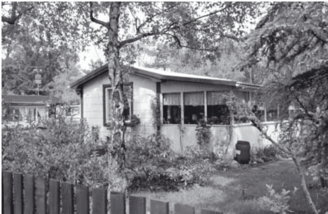
Höllvikens sommarstad vid Fritidsvägen.

Området vid Fritidsvägen som man nu betraktar som en idyll har inte alltid haft den lugna och stilla prägel som det nu har. Tidigare Rengs kommun arrenderade området på 50.000 kvm som campingplats fram till 1957. Campingeländet fick då sin slutliga lösning efter många års upp slitande kontroverser mellan kringboende och campare. När det var som flest kunde under lördag och söndag 1000 tält vara uppslagna med massor av ungdomar.