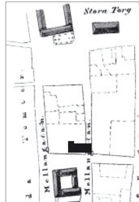
Kartan är här beskuren och med Krautmeyerska huset placerat som det låg före rivningen 1992.