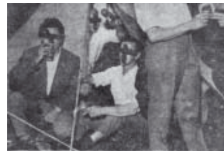
Skandalen i Höllviken

mm till trots. Området utgör dock fortfarande en idyll som ger nostalgiska återblickar om "hur det var en gång i Höllviken".