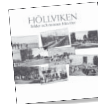
Höllviken – bilder och minnen från förr. Ny upplaga. Pris 140 kr.

Böckerna finns att köpa på biblioteken i Höllviken och Skanör samt på Bärnstensmuseet i Kämpinge, Falsterbo Museum och Turistbyrån vid Falsterbokanalerna samt på ICA-Toppen i Höllviken.