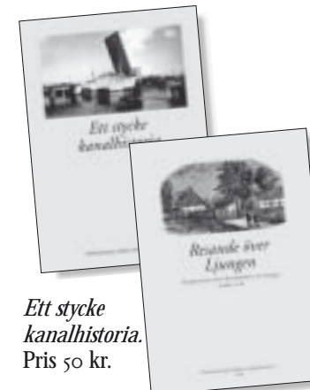
Ett stycke kanalhistoria. Pris 50 kr.