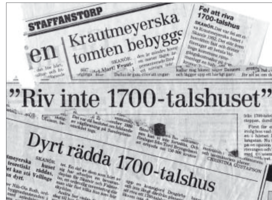
I tidningarna har 1700-talet bitit sig fast ordentligt.