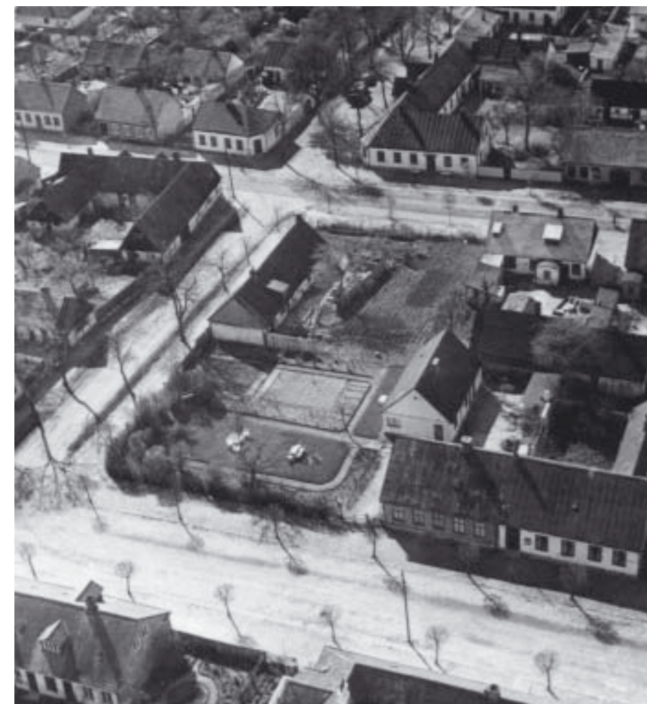
Denna flygbild, med Östergatan nedtill, visar en stor del av det område som brann 1875. Den Krautmeyerska gården ligger ensam mitt i bild med Gästis rakt över Mellangatan.