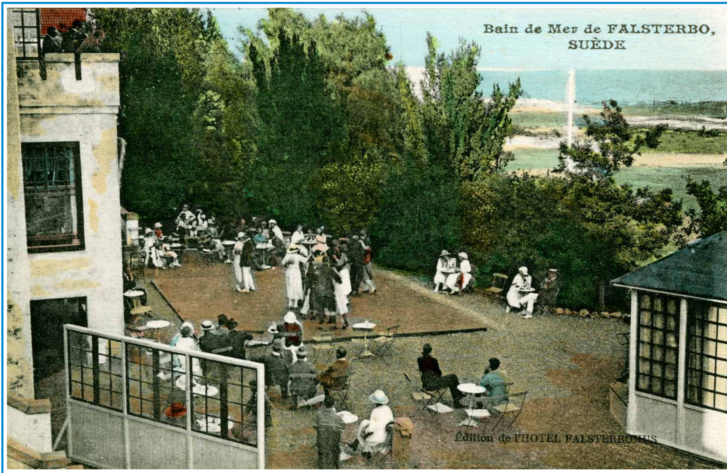
Thédansant på terrassen framför huvudbyggnaden,