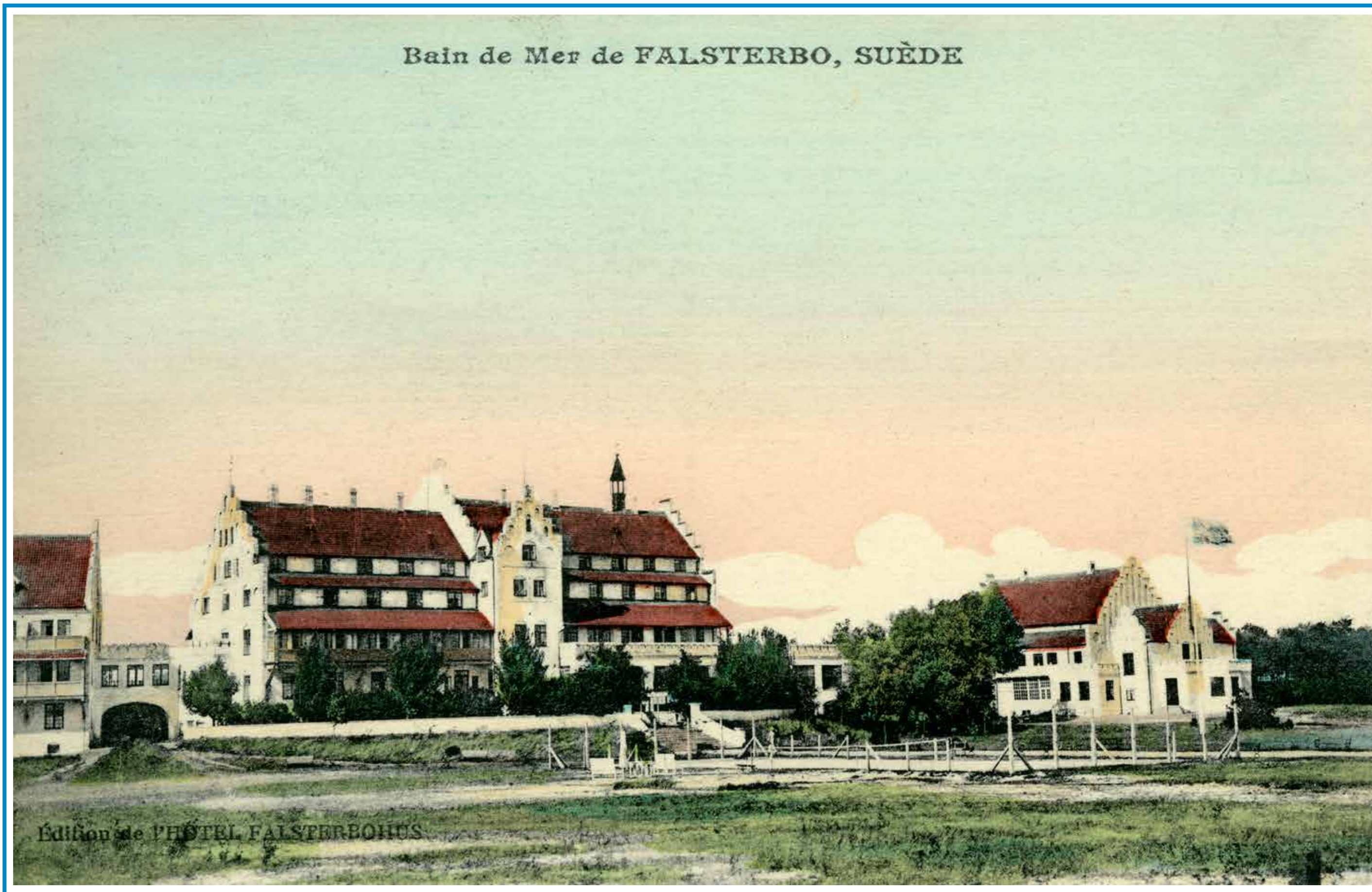
Falsterbohus huvudbyggnad stod klar 1908. Annexet till vänster och Casinot till höger tillkom 1912. Byggnaderna höjde sig skyhögt över Falsterbo då träden var få och låga.