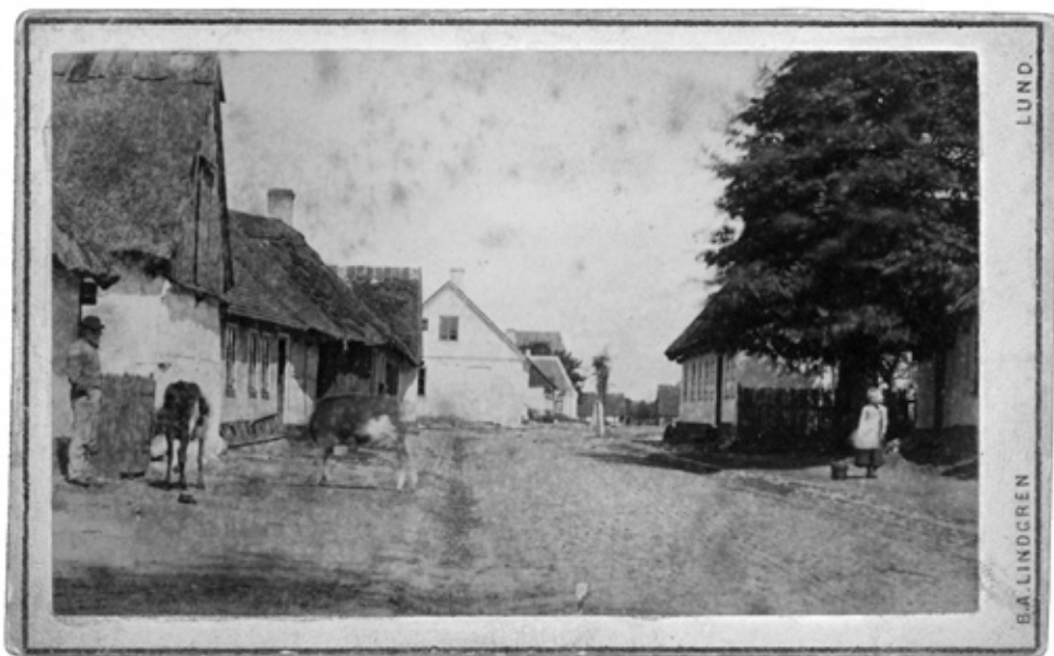
från Östergatan norrut. Bilden är tagen mellan de stora bränderna ca. 1878-79.