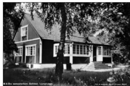
MAB & MYA:s semesterhem »Solliden« i Ljunghusen. Solliden var i seklets början en »Fjäderfäddlingsanstalt«.